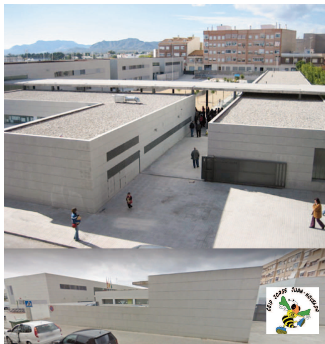
Imagen 1. CEIP Jorge Juan de Novelda

Las entrevistas fueron llevadas a cabo a un total de seis trabajadores del CEIP Jorge Juan de Novelda. Se eligió este centro por el hecho de que se estaban desarrollando actividades relacionadas con los entornos saludables y por haber contado con la participación de una enfermera escolar gracias al convenio entre el ayuntamiento de Novelda y el Consejo de Enfermería de la Comunidad Valenciana (CECOVA).